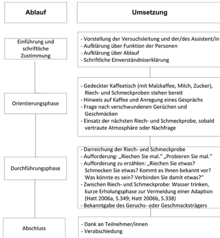
Abbildung 1: Versuchsablauf [7]