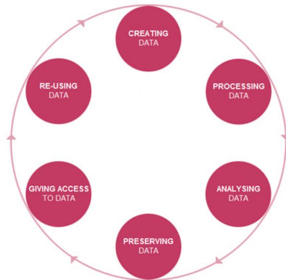
Abbildung 2: Research Data Lifecycle [Zugriff: 26.7.2013] [41]