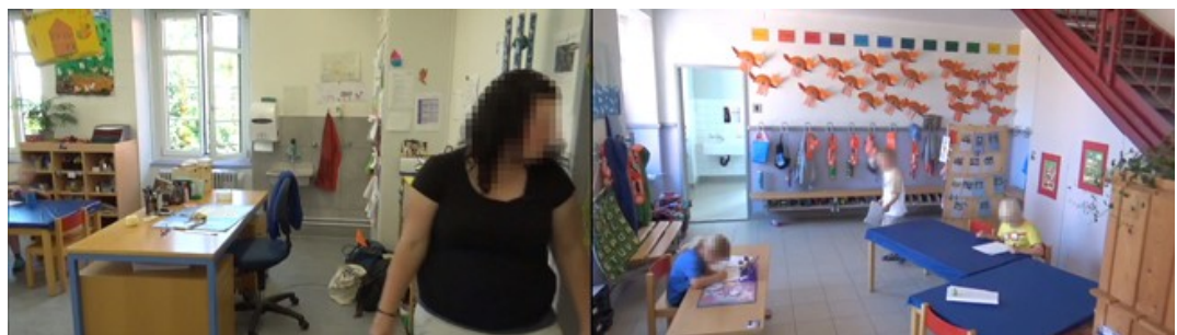
Abbildung 3: Lehrperson zirkuliert in den Klassenzimmern während einer Freispielsequenz [23]

Das zweite Beispiel stammt aus einem Kindergarten, in dem zwei separate Zimmer sowie die Garderobe im Flur, welcher die beiden Zimmer verbindet, für den Unterricht genutzt wird. Die Aufnahme in Abbildung 3 stammt aus einer Sequenz, in der alle Kinder auf diese drei unterschiedlichen Räume verteilt waren und sie im Rahmen des freien Spiels nutzten. Die linke Bildhälfte von Abbildung 3 zeigt die Aufnahme der Lehrpersonenkamera. Sie folgte der Lehrperson, die zwischen den verschiedenen Räumen zirkulierte und manchmal etwas länger mit einzelnen Kindern oder Kleingruppen sprach. Die Klassenkamera zeichnete zu diesem Zeitpunkt gemäß ihrem Auftrag in Ergänzung zur Lehrpersonenkamera die Tätigkeiten einiger Kinder auf, die außerhalb des Aktionskreises der Lehrperson agierten. Die damit verbundene Aufnahme in der rechten Bildhälfte in Abbildung 3 zeigt drei Kinder, die im Flur im Rahmen eines Rollenspiels Schule spielten. Sie entspricht genau demjenigen Anblick, der sich der Lehrperson bot, die zu diesem Zeitpunkt an der Tür vorbeiging und einen Blick in den Flur warf (daher der abgedrehte Kopf der Lehrperson in der Aufnahme in der linken Bildhälfte von Abbildung 3).