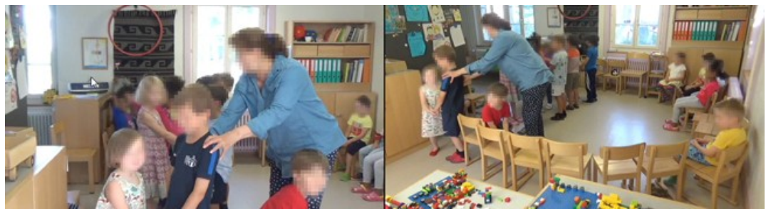
Abbildung 2: Tanzsequenz im Sitzkreis [21]

Ein wichtiges Argument für den Einsatz einer zweiten Kamera ist eine möglichst vollständige Dokumentation des Erhebungskontexts. Die Situation, wie sie in Abbildung 2 illustriert wird, ist ein Beispiel dafür, wie das parallele Anschauen der Aufnahmen beider Kameras den Kontext und die Aktionen der Kindergartenlehrperson umfassender zu erheben half als im Falle nur einer Kamera, da mit der zweiten Kamera mehr vom Ort des Geschehens – dem Sitzkreis – erfasst wurde. In anderen Worten: Man kann denselben Vorgang aus zwei unterschiedlichen Perspektiven betrachten; dies kann auch als eine triangulative Hinzuziehung des zweiten Bildes bezeichnet werden. Während der Ablauf beim alleinigen Betrachten der Aufnahmen aus der Lehrpersonenkamera (in der linken Bildhälfte von Abbildung 2 dargestellt) nachvollziehbar ist und aus diesem Grund kein Anlass bestehen würde, die Klassenkamera zu konsultieren, treten einzelne Aspekte des Geschehens beim gleichzeitigen Betrachten beider Kameras deutlicher hervor.