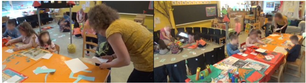
Abbildung 4: Lehrperson begleitet Kinder bei individuellen Arbeiten zu Beginn des Morgens [25]