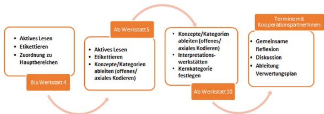
Abb. 1: EIfE-Auswertungsprozess [50]

Im Anschluss organisierten wir einen Workshop aller drei Forschungsteams, für den wir in Anlehnung an M'BAYO und NARIMANI (2015) den Begriff big discussion day wählten, auch wenn es sich hier nicht um einen Fachtag handelte. Vielmehr nutzten die Forschungsteams diesen Tag, sich die bis dahin