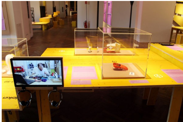
Abbildung 10: Installationsansicht "StadtFabrik: Neue Arbeit. Neues Design" mit Bionicohand

Bemerkenswert ist die Verwendung des Wortes "schön" im Hinblick auf den ästhetischen Erfahrungsraum Ausstellung und den Designkontext der Commons-Projekte. So wurde "schön" kaum benützt, um ein Objekt im Zuge einer formal-ästhetischen Auseinandersetzung zu qualifizieren. Vielmehr diente das Adjektiv dazu, Bewunderung für das soziale und/oder ökologische Engagement der Projekte auszudrücken. Eine Designexpertin reagierte etwa auf die Bionicohand : "Schön, dass es Menschen gibt, die so etwas machen können. Schön, dass es Initiativen gibt, die so jemandem helfen. Schön, dass es da Finanzierungen gibt. Schön, dass es 3-D-Drucker gibt, die diesem Menschen eine fünf-fingrige Hand ermöglichen" (Int01, Z.415-418). Selbst aus dem Designumfeld stammend, war sie sich ihrer Wortwahl bewusst und thematisierte diese, indem sie ihre "schöne" Erfahrung beim Betrachten des improvisiert wirkenden 3-D-Drucks mit der Freude beim Betrachten von hochwertig gefertigten Designerzeugnissen auf Möbelmessen gleichsetzte. Sie meinte sogar, dass sich die Aktivierung ein und derselben Gehirnregion bei ihr bei der Betrachtung von formal-ästhetisch attraktiven und als sozial relevant erachteten Dingen messen ließe (Int01, Z.414; siehe Abb. 10-11).