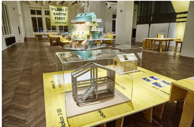
Abbildung 12: Installationsansicht "StadtFabrik: Neue Arbeit. Neues Design" mit WikiHouse und WikiVillage [47]