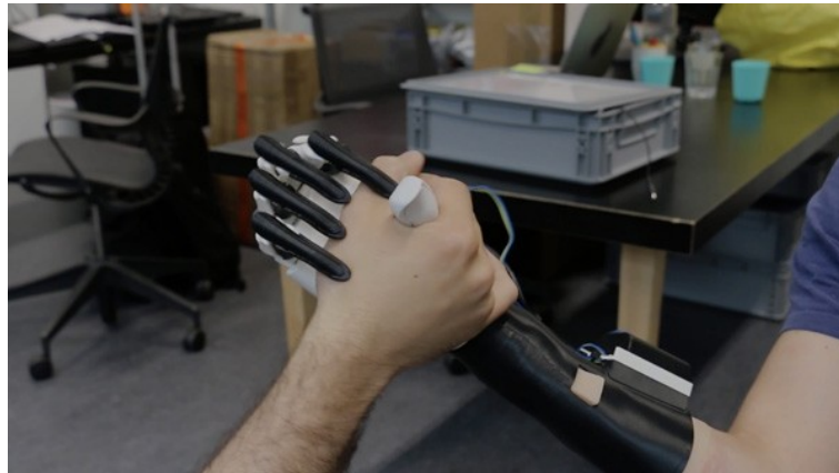
Abbildung 11: Videostill aus Bionicohand – Open Source Prosthesis for Residual Limbs (Nicolas HUCHET & Makea Industries) [44]