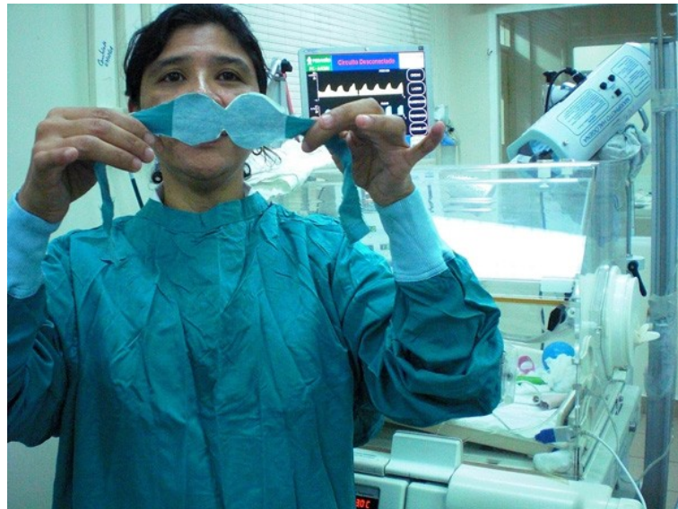
Abbildung 9: maßgeschneiderte Augenbinde für Neugeborene zum Schutz während der Phototherapie, entwickelt von MakerHealth in Nicaragua (Anna YOUNG) [40]

sensorischen Auseinandersetzung und entsprechende Interessensschwerpunkte dar. Während beispielsweise in einem Protokoll "wenig körperliche Resonanz" und ein eher ratloses "mh" als Reaktion eines Gesundheitsexperten auf die 3-D-gedruckte Scheckschablone für Menschen mit Sehbehinderung dokumentiert wurden, wurde an anderer Stelle ein sich "gleich auf das Objekt Stürzen" in Bezugnahme auf die Augenbinde für Neugeborene aus ehemaliger OP-Kleidung zum Schutz bei Bestrahlungen festgehalten (Prot02, siehe auch Abb. 9). Solche sensorischen Interessensbekundungen waren im begleiteten Interview im Gehen für die Interviewenden aufschlussreich, da sie Hinweise auf den von den Befragten mitgebrachten Bezugshorizont gaben und persönliche sowie berufliche Angriffspunkte zum Thema betonten. Beim AIR besteht zudem die Möglichkeit, an Objekten, die kein Interesse hervorrufen, einfach vorbeizugehen. So liefert auch die Nichtbeachtung von Objekten Erkenntnisse – ohne dass die Teilnehmer*innen gezwungen sind, dies für die Forscher*innen zwingend in einem Rechtfertigungskontext verbalisieren zu müssen.