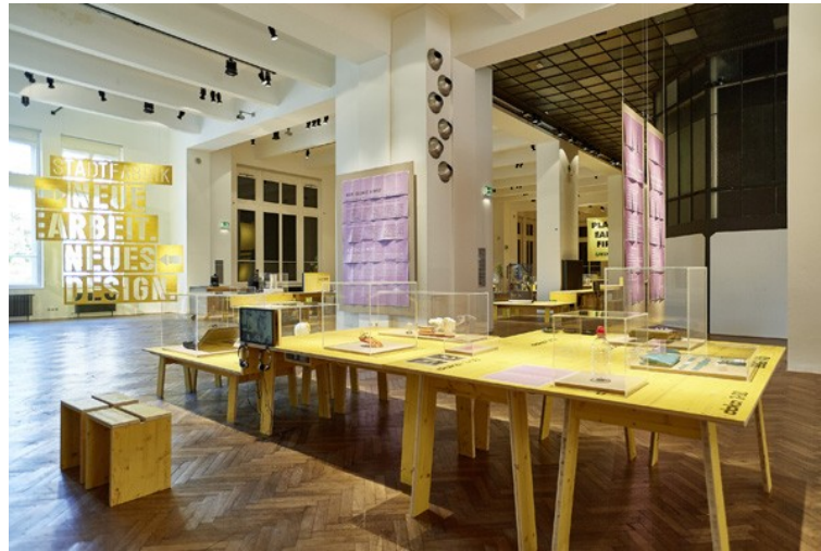
Abbildung 1: Installationsansicht "StadtFabrik: Neue Arbeit. Neues Design" [7]

Die Ausstellung wurde als kollektiver Prozess verstanden, zu dem verschiedene Akteur*innen mit ihrem Wissen und ihren Objekten beitrugen. Das Kurator*innenteam (Martina FINEDER, Harald GRUENDL und Ulrike HAELE) wählte in enger Zusammenarbeit mit den Akteur*innen der jeweiligen Projekte geeignete Artefakte von Manifesten über Prototypen bis hin zu Videointerviews aus. Bei der Auswahl des Materials ging es nicht vordergründig darum, den Repräsentationscharakter der Objekte für ein Projekt herauszustreichen. Vielmehr sollten die Objekte im Sinne von Arbeitsmaterialien verschiedene Angriffspunkte für die Auseinandersetzung der Besucher*innen mit dem Commons-Beispiel bieten. Sämtliche Ausstellungstexte waren entsprechend inklusiver "Leichte-Sprache"-Bemühungen im Museum (AL MASRI-GUTTERNIG & REITSTÄTTER 2017) verfasst. Den Ausstellungstext gestalteten wir damit nach einem "Design for all"-Prinzip, d.h. er sollte für den Großteil der Bevölkerung über den engen Kreis von Fachleuten hinaus verständlich sein. [8]