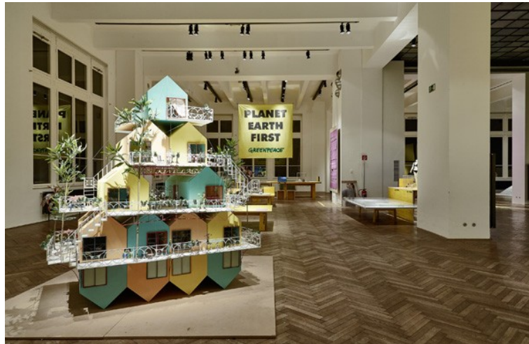
Abbildung 8: Installationsansicht "StadtFabrik: Neue Arbeit. Neues Design" mit WikiVillage (Modell im Maßstab 1: 50) von Andrés Jaques Architects [34]