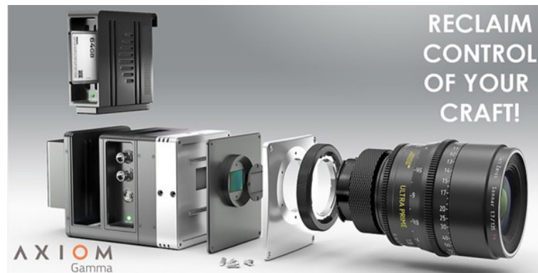
Abbildung 7: Broschüre zur Präsentation des apertus° Axiom-Projekts [31]