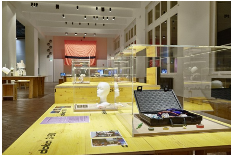
Abbildung 4: Installationsansicht "StadtFabrik: Neue Arbeit. Neues Design" mit MakerHealth/MakerNurse und der Refugee Nation Flag im Hintergrund [26]

Bei jedem Rundgang wurden diese vier Ausstellungseiseln mit den Teilnehmer*innen nacheinander besucht (Abb. 4). Diese chronologische Abfolge, die zusätzlich (aber für den AIR nicht zwingend notwendig) in einem Gesprächsleitfaden festgehalten wurde, entsprach der räumlichen Logik des Ausstellungsbesuches (vom Einführungstext immer weiter in die Ausstellung hinein). Gleichzeitig lenkte sie die Teilnehmer*innen zu den Beispielen, sodass alle mit denselben Artefakten konfrontiert wurden. In welcher Reihenfolge und mit welcher Intensität sich die Teilnehmer*innen jedoch mit den einzelnen Ausstellungsobjekten der Inseln auseinandersetzen, war ganz ihnen selbst überlassen. Die Strukturierung der Rundgänge war damit zum einem im Groben (im Sinne einer Vergleichbarkeit) durch den räumlichen Leitfaden geregelt. Hinsichtlich der Auseinandersetzung mit den Artefakten konnten die Teilnehmer*innen ihren Rezeptionsmodus zum anderen individuell (im Sinne einer Selbst-Strukturierung) bestimmen. Insofern variierte auch die konkrete Dauer der Interviewrundgänge von einer bis eineinhalb Stunden.