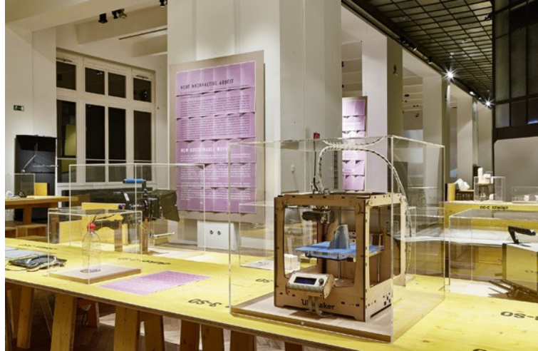
Abbildung 2: Installationsansicht "StadtFabrik: Neue Arbeit. Neues Design" mit der Social Furniture Collection des Designstudios EOOS und Wandtexten [11]

lose an die Wand getackerte A3-Blätter, die auch im Homeoffice hätten hergestellt werden können (EOOS 2016; FINEDER et al. 2017, S.33; siehe Abb. 2).