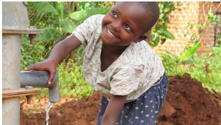
Abbildung 6: Videostill aus The Fair Cap