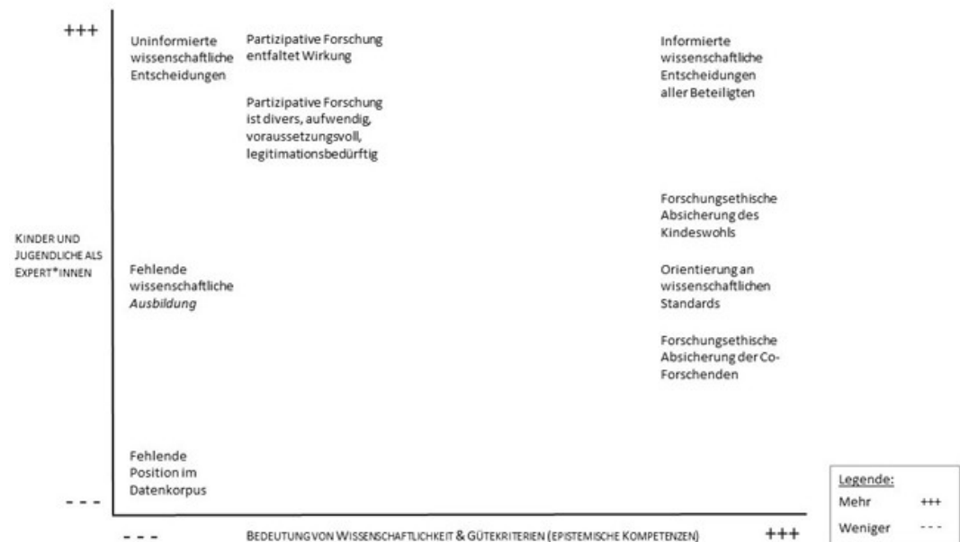
Abb. 3: Auszug der Positions-Map der Forschungssituation in Peer2Peer (eigene Darstellung nach CLARKE et al. [2018]) [61]

[2005], S.156). Damit ist keine normative Wertung einzelner Akteur*innengruppen oder Aktant*innen intendiert, sondern in Rekurs auf Michel FOUCAULT (1974 [1966]) sind heterogene Diskurspositionen von Interesse (vgl. auch DIAZ-BONE 2012). Im Zuge der Analyse kann es sinnvoll werden, (fehlende) Positionierungen mit den dahinterstehenden (nicht-)sprechenden Personen(-gruppen) zu verknüpfen (CLARKE 2012 [2005], S.166; KELLER et al. 2013, S.187).