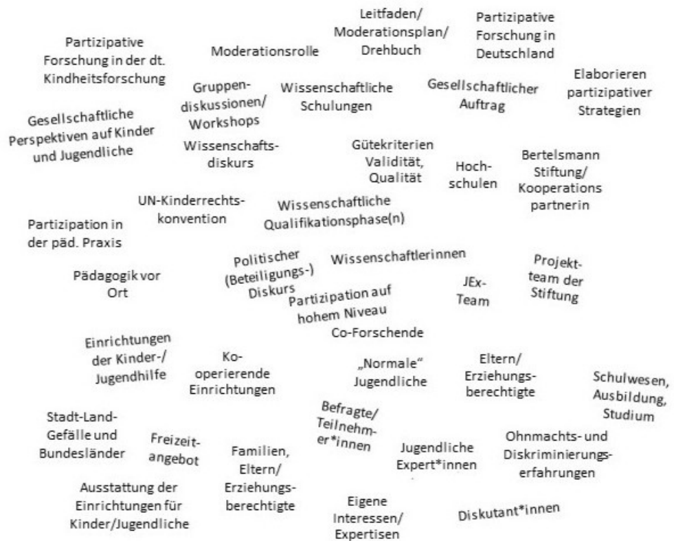
Abb. 1: Auszug aus der Messy-Map der Forschungssituation Peer2Peer (eigene Darstellung nach CLARKE et al. [2018]) [29]

Situations-Maps ermöglichen es, in einem ersten Schritt die zu untersuchende Forschungssituation zu bestimmen, indem alle sichtbaren, nicht sichtbaren und (nicht-)menschlichen Akteur*innen und Aktant*innen bis hin zu diskursiven Konstruktionen kartiert werden (CLARKE 2012 [2005], S.135). Innerhalb dieser zunächst noch ungeordneten Karte, der Messy-Map, werden in einem weiteren Schritt Beziehungsgeflechte durch Linienverbindungen zueinander dargestellt und analysiert. Parallel dazu werden Memos verfasst, um Informationen über Positionierungen, Repräsentationen oder andere Auffälligkeiten sowie Besonderheiten sichern. Durch das Mappen aller Elemente in einer solchen Situations-Map können also auch (noch) nicht sichtbare, aber mitunter wirkmächtige Einflüsse aufgedeckt werden.